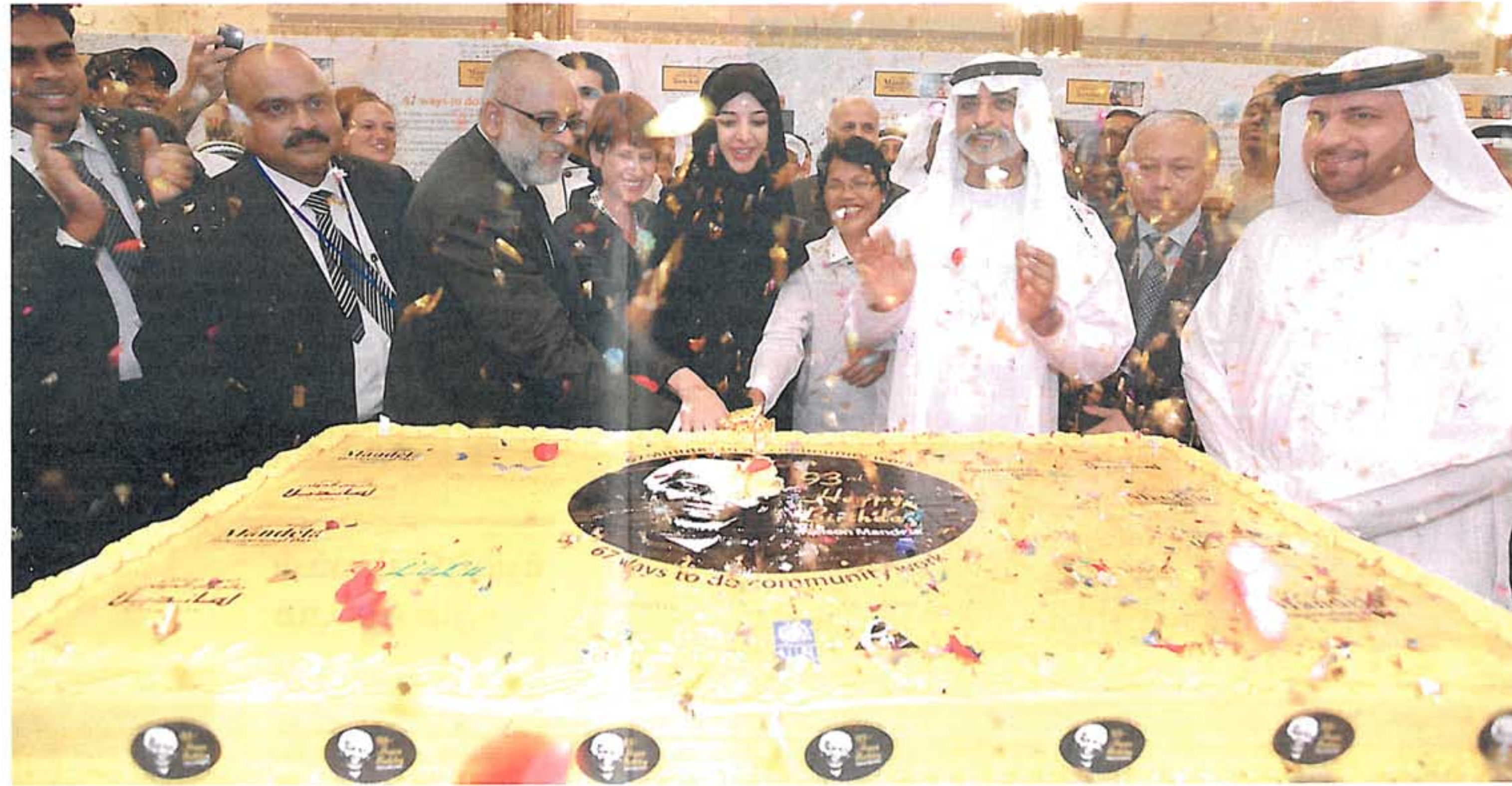
نهيان بن مبارك وريم الهاشمي وعدد من كبار الشخصيات خلال الاحتفالية.

كبيراً من مختلف الأعمال، تجمعوا لمشاهدة تقطيع كعكة عيد الميلاد التي وصل طولها إلى 76 بوصة، تطلوها صورة كبيرة لمانديلا. وتوجه سفير جنوب إفريقيا في الإمارات يعقوب أبو عمر، بالتحية والشكر للإمارات والمقيمين فيها للمشاركة في هذا الحدث التاريخي، ودعاهم لمسيرة مانديلا التي اتسمت بالنضال الدؤوب لجعل العالم مكاناً أفضل للعيش فيه. بينما اعتبرت المنسق المقيم للأمم المتحدة برنامج الأمم