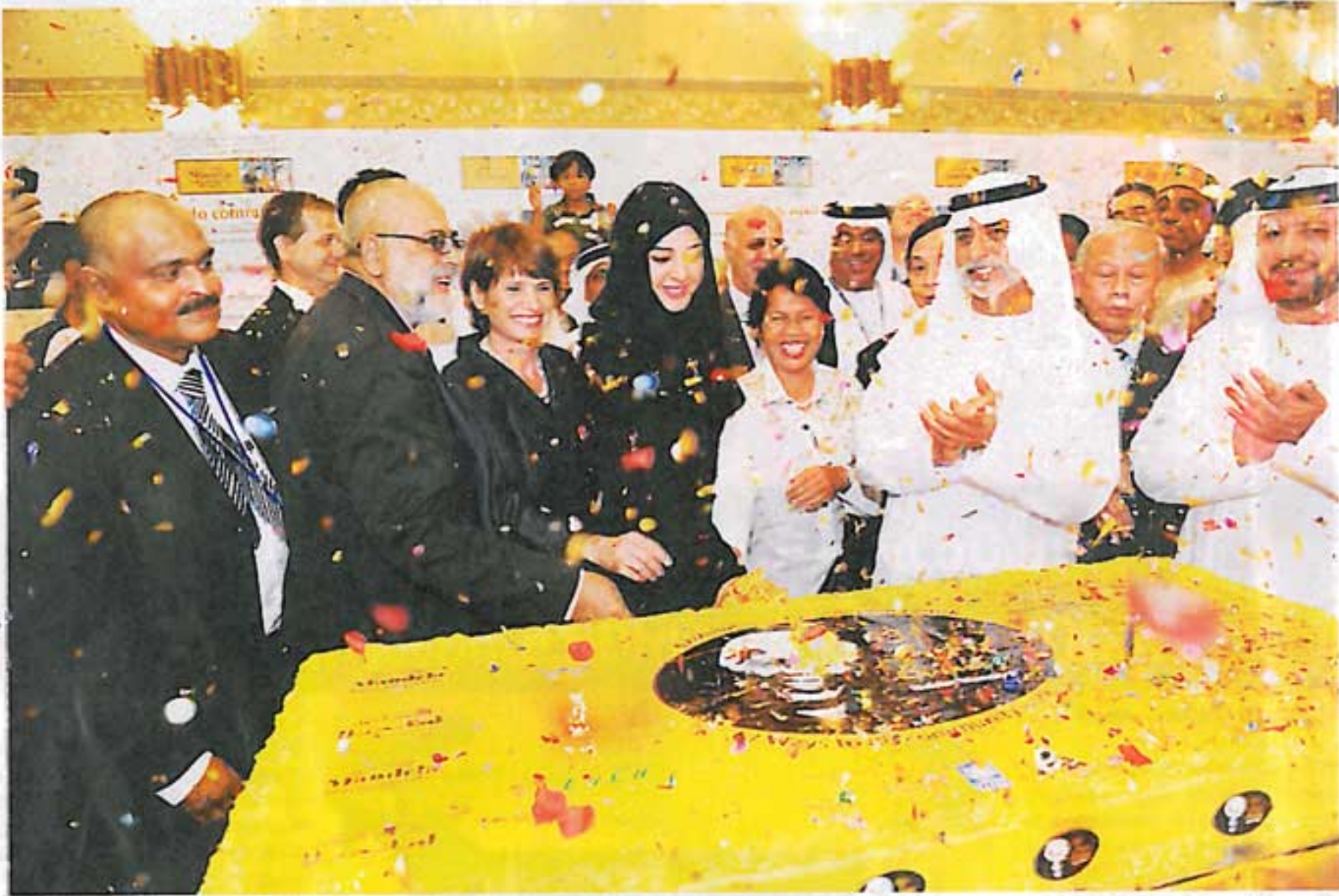
അബുദാബി ഖാലിദിയ മാളിൽ നെൽസൺ മരണലയുടെ 93-ാം പിറന്നാൾ ആഘോഷം ശൈഖ് നഹ്യാൻ ബിൻ മുബാറക് അൽ നഹ്യാൻ ഉദ്ഘാടനം ചെയ്യുന്നു